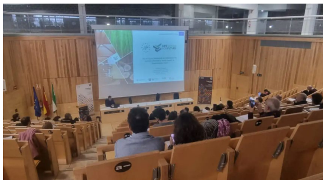
Fig 17. Presentación de la participación del proyecto LIFE WOOD FOR FUTURE en el proyecto IMPRONTA Granada

El 1 de diciembre de 2022, en la ETS de Arquitectura, comenzaron los laboratorios de innovación y co-creación en el marco del proyecto Impronta Granada, que pretende sistematizar la relación entre la Diputación de Granada y la Universidad de Granada, generando un espacio de diálogo creativo y productivo entre las instituciones y los actores sociales. Esta primera acción, en la que han participado más de cien personas, ha abordado los desafíos del cambio climático en Granada.