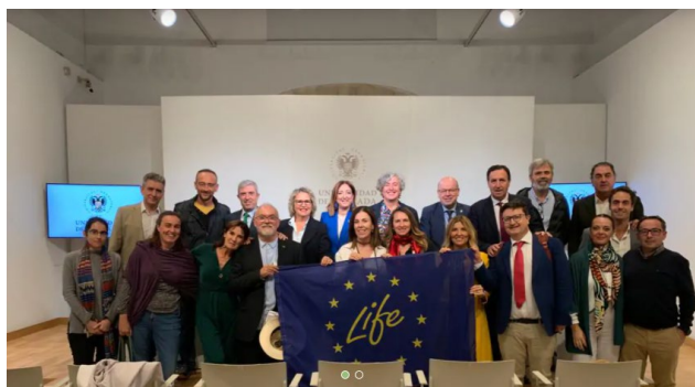
Fig 15. Asistentes a la presentación de la Cátedra Cívitas-UGR de Sostenibilidad

empresarial y la academia en las áreas de sostenibilidad, innovación y formación.