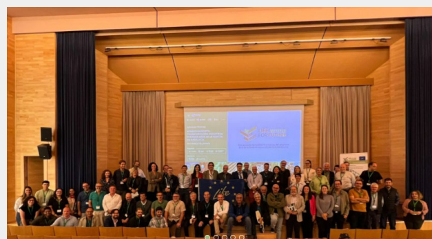
Fig 7. Participantes en las jornadas sobre aprovechamiento, transformación industrial y nuevos usos de la madera

La madera, material con base biológica y extraordinarias propiedades mecánicas y de mecanizado por control numérico, se considera hoy día como el más apropiado para esta transformación en el sector.