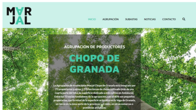
Fig 5. Portada del espacio web de la Asociación Marjal

La Agrupación de Productores de Chopo de Granada, Marjal, ya tiene espacio web. La página de la agrupación ha comenzado su singladura con el lanzamiento de la primera subasta de madera de chopo de madera Marjal.