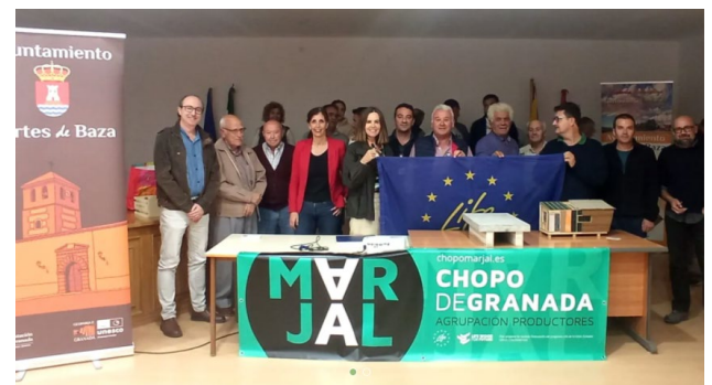
Fig 13. Miembros del Geoparque en Granada posan junto miembros del proyecto LIFE

El Geoparque de Granada colabora con proyecto europeo LIFE Wood for Future-Madera para el Futuro con el objetivo de que las choperas se conviertan en un referente para el impulso económico del territorio . Esta colaboración se formalizó el 3 de noviembre de 2022 en Cortes de Baza.