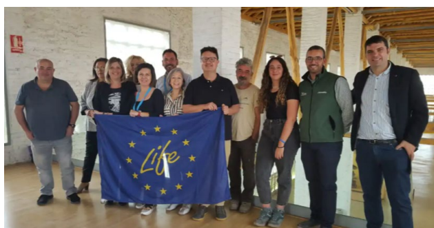
Fig 10. Participantes en las Jornadas Europeas de Patrimonio posan junto la bandera LIFE

El Ayuntamiento de Vegas del Genil en la Vega de Granada acogió el 21 de octubre de 2022 el