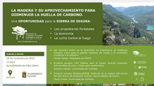
Fig 14. Portada de la presentación en Siles del proyecto de desarrollo económico para la comarca

El Ayuntamiento de Siles ha acogido este viernes una jornada que, bajo el título ' La madera y su aprovechamiento para disminuir la huella de carbono: una oportunidad para la Sierra de Segura ', presentó a propietarios forestales y otros agentes sociales y económicos un proyecto de desarrollo sostenible para esta comarca, que abarca municipios de las provincias de Jaén y Granada.