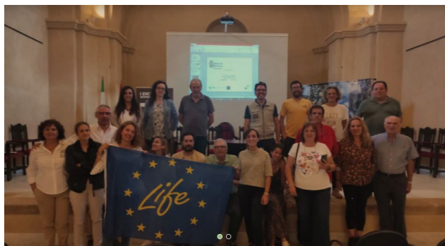
Fig 9. Miembros del proyecto LIFE en el encuentro celebrado en el Centro de Interpretación de Sierra Morena-Santa Ana (Guadalcanal)

Para ello, tras una introducción sobre conceptos vinculados con este tipo de proyectos y las diferentes fuentes de financiación que ofrece la Unión Europea, se exponen dos proyectos que han tenido un impacto directo en el Geoparque de Granada.