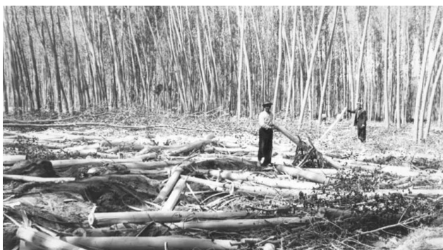
Fig 3. Labores corte choperas en los 80

Las choperas en Granada fueron claves en el desarrollo de otros cultivos que permitieron crecer a la provincia, como la remolacha o el tabaco. Ahora se postulan como un valor seguro, con beneficios medioambientales asegurados.