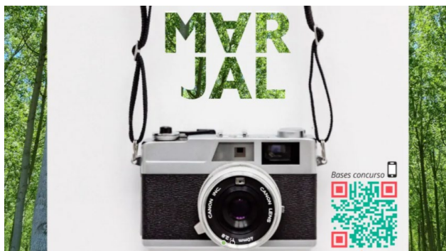
Fig 12. Cartel del concurso con código QR que adjunta las bases del concurso

El 4 de noviembre de 2022 se adjuntó la convocatoria para el I Concurso de Fotografía Choperas de Granada : Marjal, organizado por la Agrupación Marjal, el proyecto LIFE Wood for Future y la Universidad de Granada, con el patrocinio de la Cátedra Cívitas-UGR de Sostenibilidad.