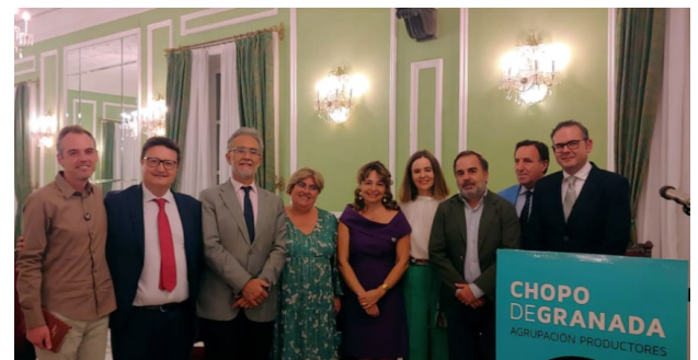
Fig 6. Los productores de chopo organizan la primera subasta de madera de la historia de Granada

La asociación Marjal se presentó el 29 de septiembre de 2022 en el Carmen de los Mártires ante representantes del Ayuntamiento de Granada, la Junta de Andalucía, la Diputación Provincial y la Universidad.