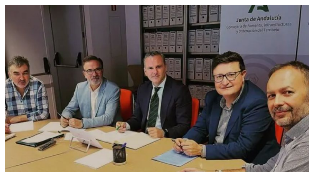
Fig 4. El Director General de AVRA posa junto representantes de la UGR y de la ETSIE

El 23 de septiembre de 2022 se celebró una interesante y provechosa reunión entre AVRA (Consejería de Vivienda, Articulación del Territorio y Vivienda) y la Universidad de Granada (UGR) en el marco del proyecto LIFE Wood for Future.