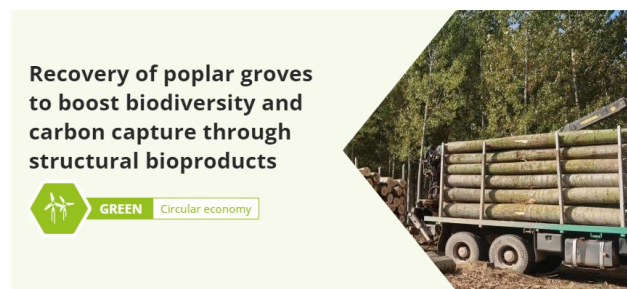
Fig 11. Portada de la publicación del Proyecto LIFE en la web Interreg