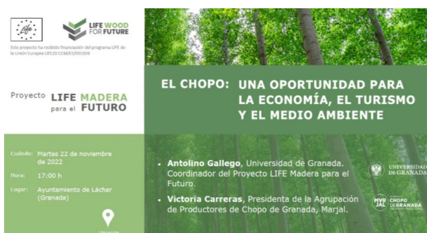
Fig 16. Portada presentación del proyecto LIFE WOOD FOR FUTURE en Láchar.

toda la cadena de valor, desde el uso de planta certificada, la implantación del modelo selvícola de Gestión Forestal Sostenible, la necesidad de agruparse, la venta de créditos de carbono, y el desarrollo de nuevos productos para poner en valor la madera de sus plantaciones.