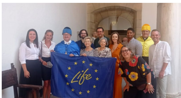
Fig 1. Miembros del proyecto LIFE en el acto de la ceremonia de apertura del curso académico

El coordinador del proyecto LIFE Wood for Future dictó el día 10 de septiembre de 2022 la lección inaugural de la ceremonia de apertura del curso académico 2022-2023 , en el Hospital Real, sede del Rectorado.